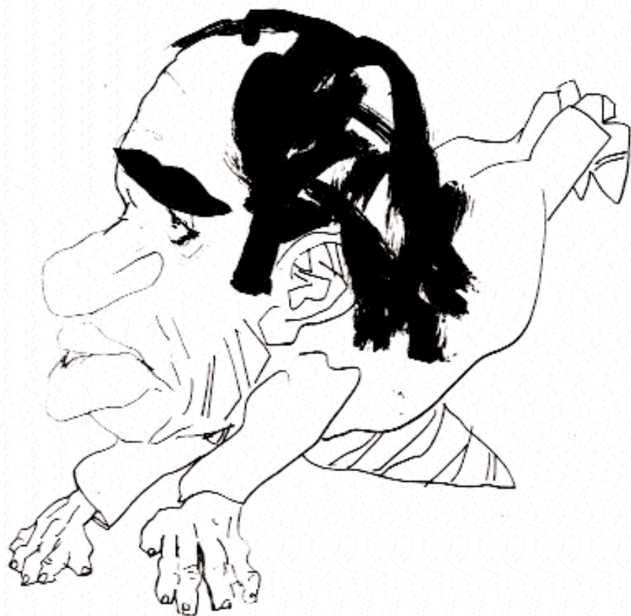
Ex presidente Carlos S. Menem