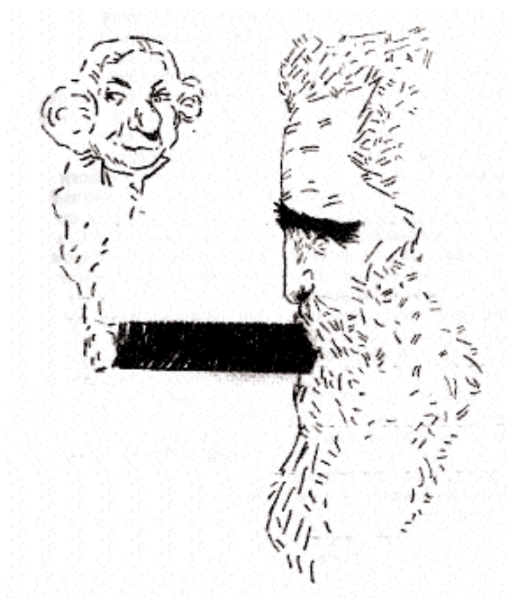
Fidel Castro y George Washington Archivo RE 156